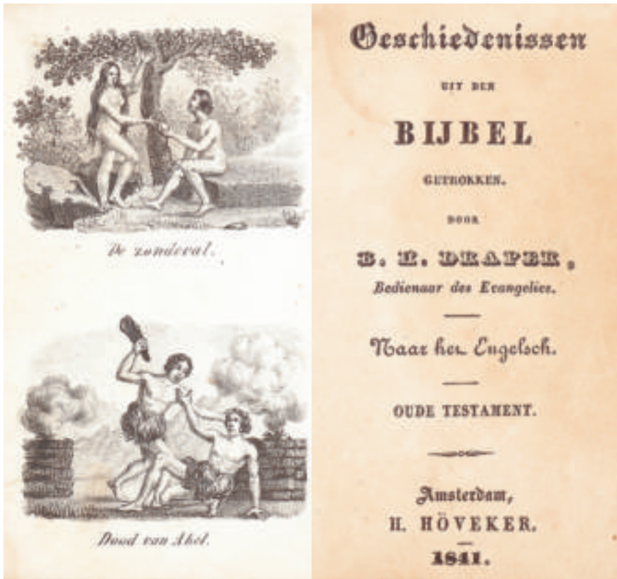
▲ Titelblad en afbeelding ertegenover, uit: B.H. Draper, Geschiedenissen uit den Bijbel getrokken , Amsterdam 1841.