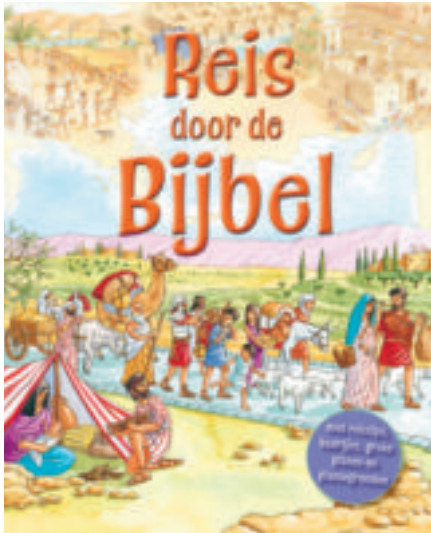
▲ Omslag Reis door de Bijbel

Dit voorjaar verschijnen er twee bijzondere bijbeledities en twee bijbeluitgaven voor kinderen.