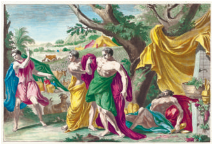
▲ De dronkenschap van Noach, uit: Historie des Ouden en Nieuwen Testaments, Verrykt met meer dan vierhonderd Printverbeeldingen [...] , Amsterdam 1700.