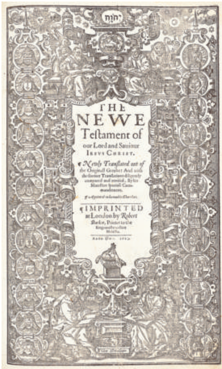
▲ Titelblad Nieuwe Testament, uit: The Holy Bible. Conteyning the Old Testament and the New. Newly Translated out of the Originall tongues [...] , London 1613.