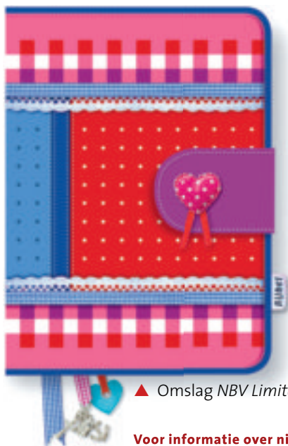
▲ Omslag NBV Limited Edition