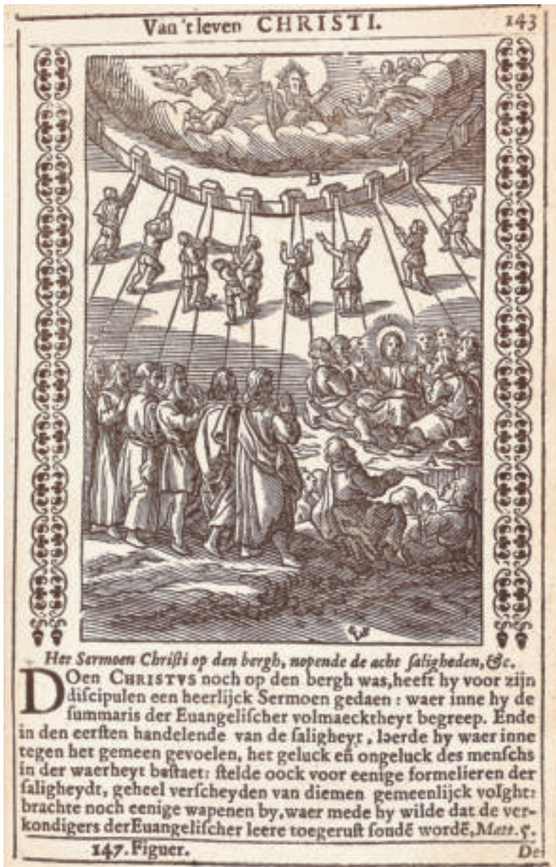
▲ De Bergrede, uit: Christoffel van Sichem, 't Schat der zielen, dat is: Het geheele leven ons Heeren Iesu Christi [...] , Amsterdam 1648.