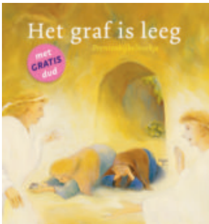
▲ Omslag Het graf is leeg