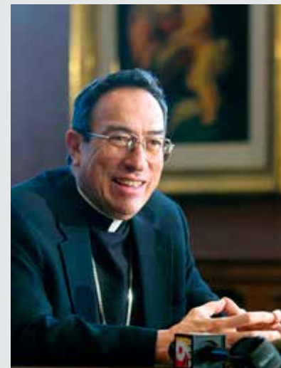
Kardinaal Rodríguez Maradiaga: ‘Gods liefde wijst ons de weg om zelf lief te hebben.’

‘Mijn ideaal is dat we de woorden die in deze gezinsbijbel staan, in de praktijk brengen. Een voorbeeld: de geboden ‘Je zult niet stelen’ en ‘Je zult niet liegen’ worden vaak met voeten getreden, soms zonder dat we het idee te hebben dat we iets