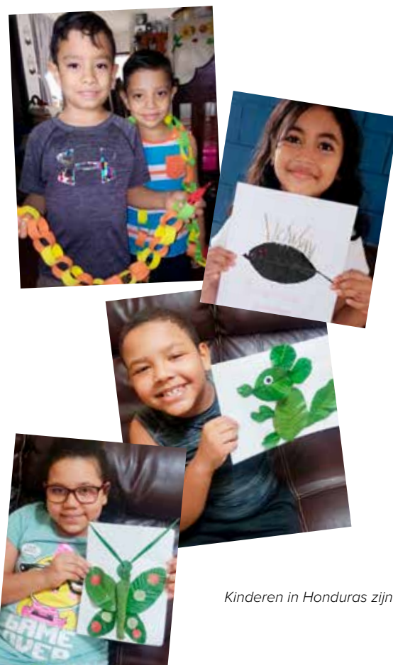
Kinderen in Honduras zijn enthousiast aan de slag gegaan met de opdrachten in de Samenleesbijbel.

Wilt u meer weten over onze missie en doelstellingen? Kijk dan op bijbelgenootschap.nl/missie of op bijbelgenootschap.be/missie .